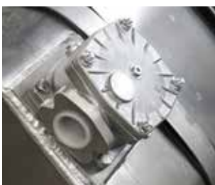
TILLVAL: RETUROLJEFILTER MED DUBBLA ANSLUTNINGAR