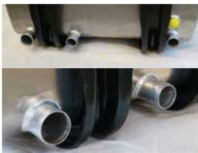
TILLVAL: TVÅ ELLER TRE SUGANSLUTNINGAR