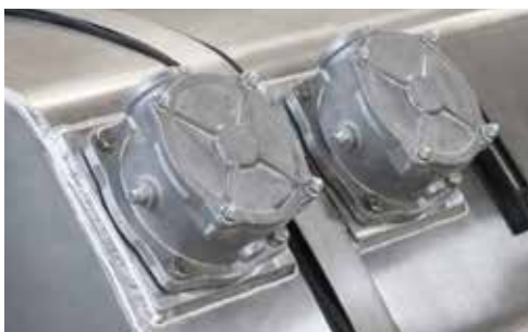
TILLVAL: DUBBLA RETUROLJEFILTER