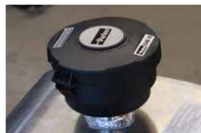
STANDARD: LUFTFILTER FRÅN PARKER