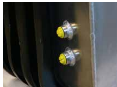
TILLVAL: DUBBLA ANSLUTNINGAR FÖR DRÄNERLEDNINGAR